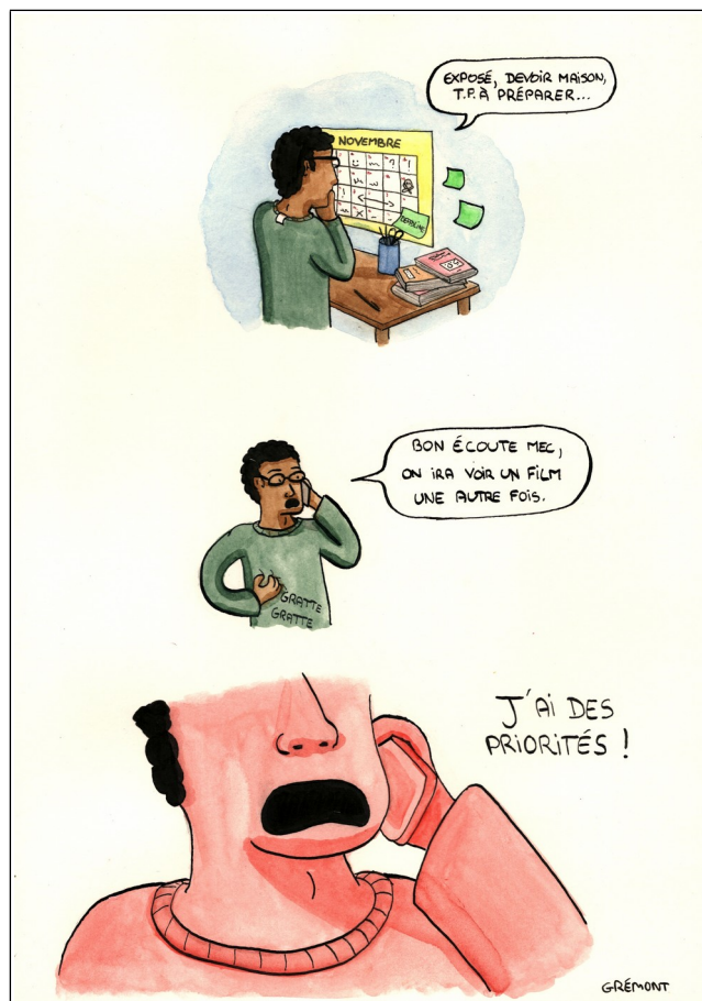
Fig.3 – Les origines de l'université. Illustration de Gwendoline Simon, DU créations de bandes dessinées, UPJV, UFR des Arts, site de l'artiste : https://gwendolinesimon.fr/